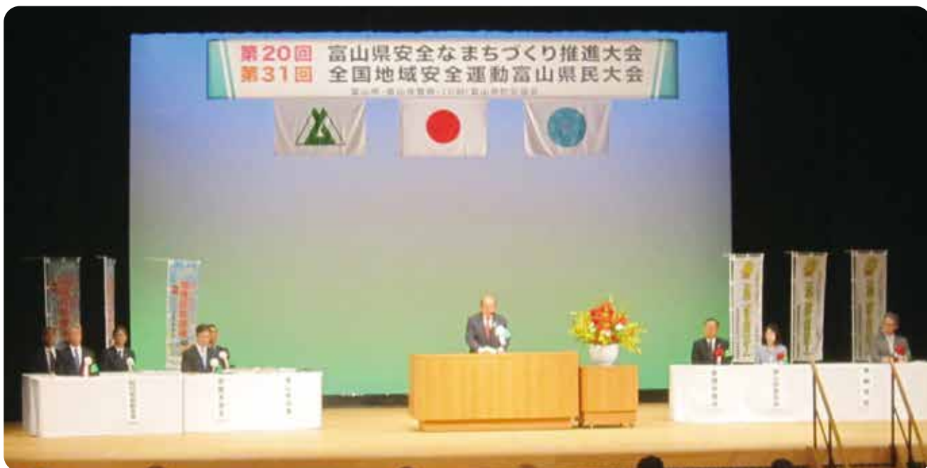
▲10月3日(木)富山県民会館において第20回富山県安全なまちづくり推進大会・第31回全国地域安全運動富山県民大会が開催され、地域安全活動に取り組んでいる9団体と個人34名が県知事・県警察本部長から表彰されました。