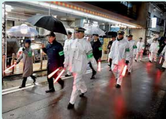
出発式と合同パトロールの様子