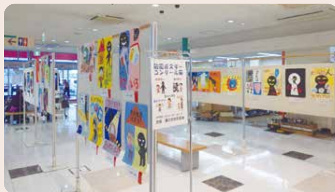
防犯ポスターコンクール展

滑川市防犯協会、滑川警察署、 滑川市民間パトロール隊協議会、青色パトロール隊 (令和6年10月9日、滑川警察署)