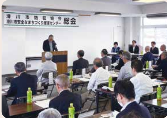
滑川市防犯協会総会

滑川市防犯協会、滑川市安全なまちづくり推進センター、 滑川警察署 (令和6年5月23日、滑川市役所東別館3階大会議室)