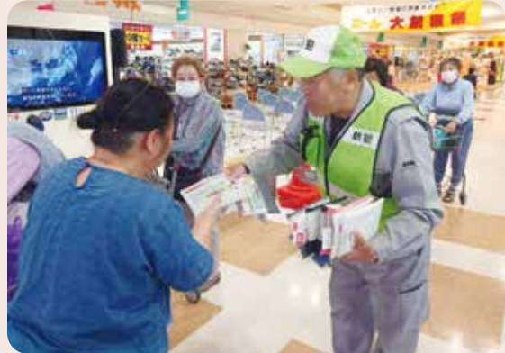
「ロック」の日カギかけキャンペーン

滑川市防犯協会、滑川市安全なまちづくり推進センター、 滑川警察署 (令和6年5月23日、滑川市役所東別館3階大会議室)