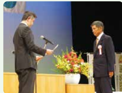
高木警察本部長から表彰伝達