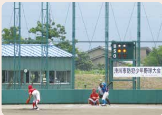
第18回滑川市防犯少年野球大会

滑川市防犯協会、滑川警察署、 滑川市少年野球連絡協議会、滑川市教育委員会 (令和6年8月25日、滑川市営有金球場)