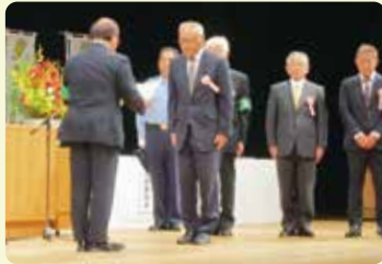
県知事表彰授与の様子

10月3日(木)富山県民会館において、当協会、県、県警察主催で、県民の防犯意識の高揚を目的とした「第20回富山県安全なまちづくり推進大会・第31回全国地域安全運動富山県民大会」が開催され、約400人が参加しました。