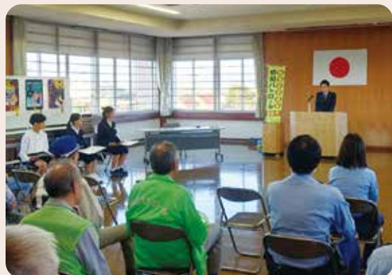
地域安全運動出発式、防犯ポスターコンクール表彰式

滑川市防犯協会、滑川警察署、 滑川市少年野球連絡協議会、滑川市教育委員会 (令和6年8月25日、滑川市営有金球場)