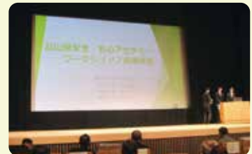
高岡法科大学生による成果発表

第2部では、高岡法科大学生による富山県安全・安心アカデミーの成果発表がありました。